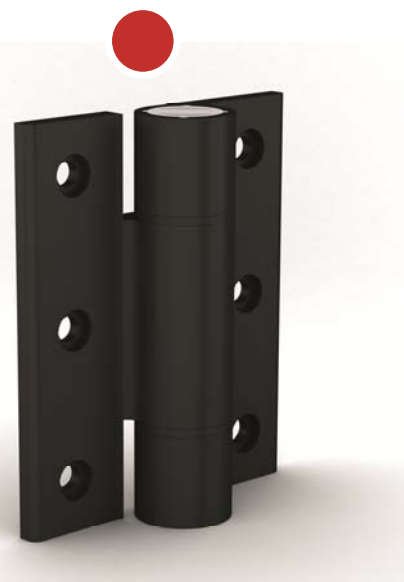
Charnière à ressort en profil aluminium anodisée noire 3,80 Nm (72-1-4232) (Charnière anodisée noire sans ressort 72-1-4242)