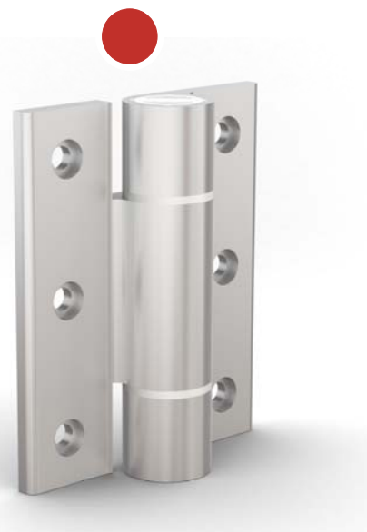
Charnière à ressort en profil aluminium anodisée incolore 3,80 Nm (72-1-4231) (Charnière anodisée incolore sans ressort 72-1-4241)