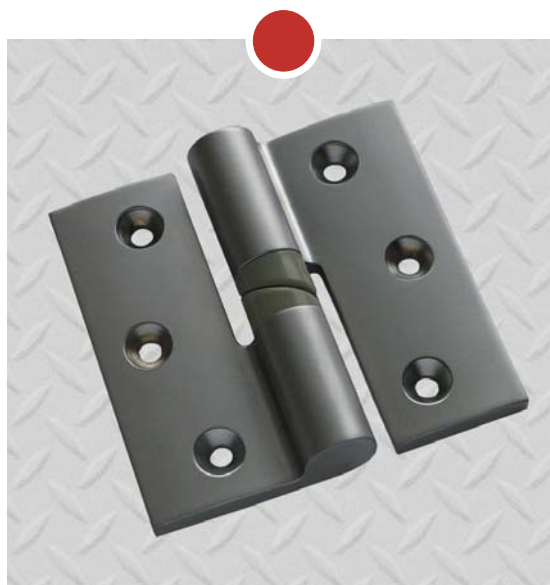
Paumelle à rampe à gauche 14-1-3798