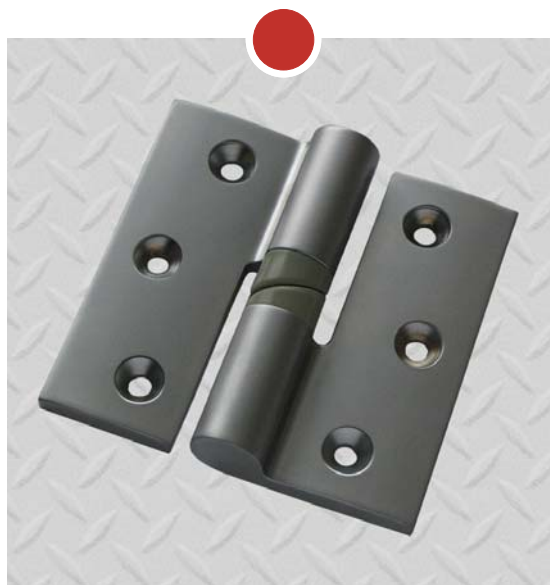
Paumelle à rampe à droite 14-1-3797

Autres charnières pour mobilier de piscines et collectivités : voir notre catalogue.