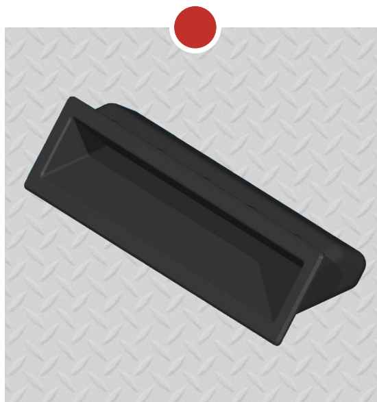
Poignée à encliqueter 19-7-3826 (profonde)